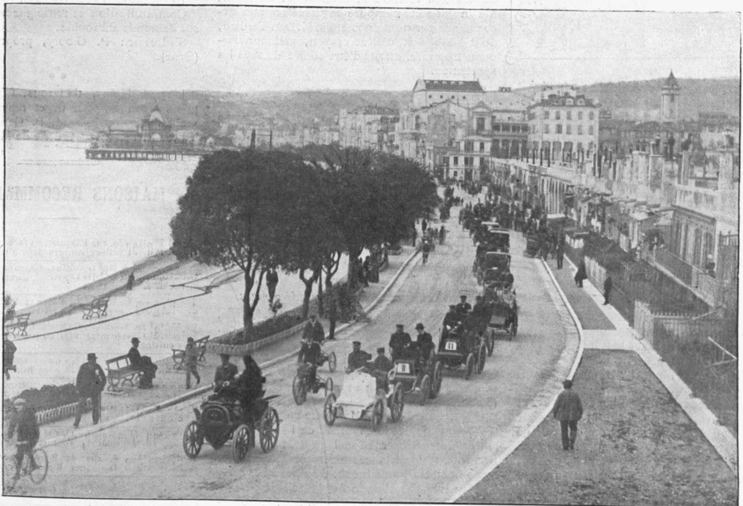
LE DÉFILÉ DES AUTOMOBILES A NICE. — DÉPART POUR LE CONCOURS DE MONTE-CARLO.